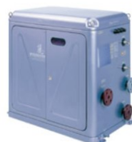
循環ろ過装置 パッケージ型 コンパクト SPN 麗シリーズ