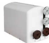
ショウエイ 温泉対応 循環ろ過装置システム等