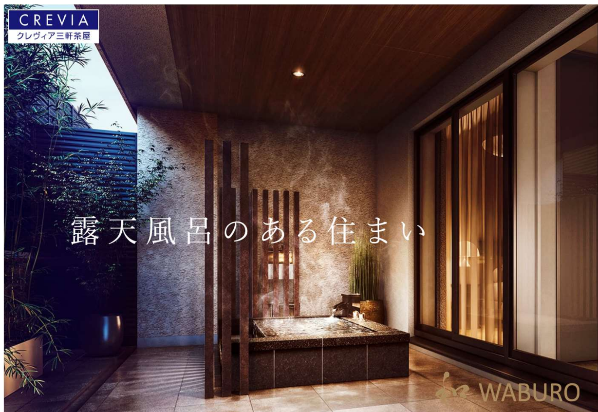
1F2邸の石貼り浴槽のWABURO 露天風呂（選美槽 えらびそう）