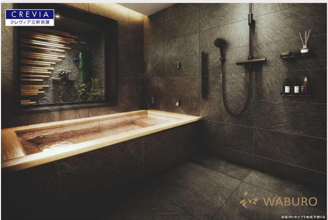
石貼り浴槽のある WABURO PM Premier Line（6 邸）