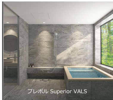
WABURO プレポル UB タイプ 規格型 7 シリーズ 200-500万円台