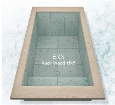
WABURO ERN 単品浴槽タイプ 規格型 5サイズ 85-130万円