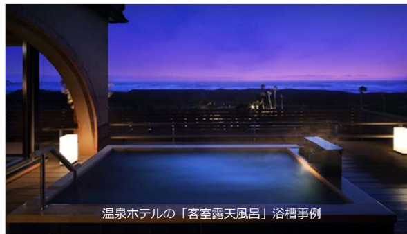
WABURO 「選美槽」自由設計タイプ フリーオーダー石貼り浴槽えらびそうシリーズ