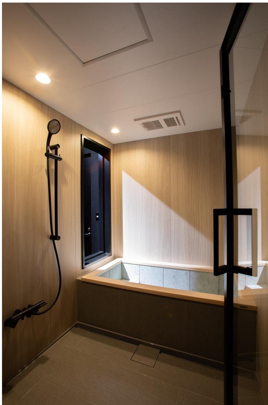
※新商品「CL-LINE SEREN」(1620 サイズ)

タイルや石貼り浴槽の質感をはじめ、浴槽サイズによるスケール感など、 写真やカタログだけでは伝えきれない要素を実際の展示を通してご確認ください。