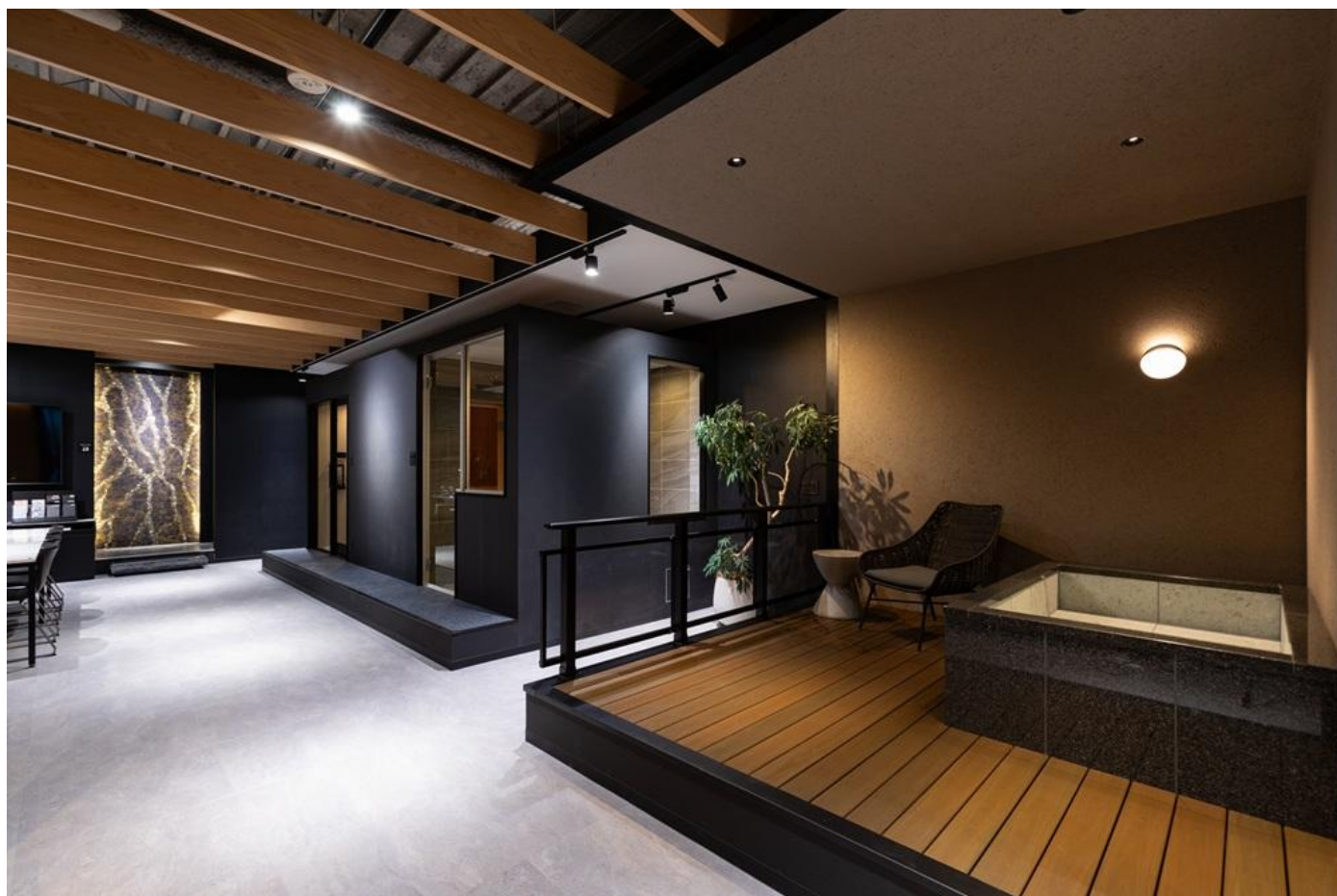
※規格の石貼り浴槽 ERN シリーズ（1711 サイズ）

また、新たに 規格型石貼り浴槽（ERN）の 1711 サイズ を展示し、 サイズバリエーションによるスケール感もご覧いただけます。