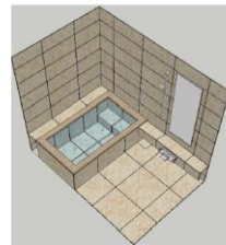
タイル：ベージュ 浴槽：ロックウッドタイプ 石材：十和田