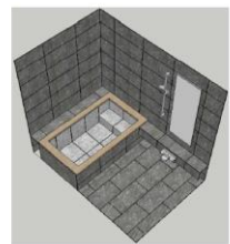
タイル：グレー 浴槽：ロックウッドタイプ 石材：御影石 ホワイト