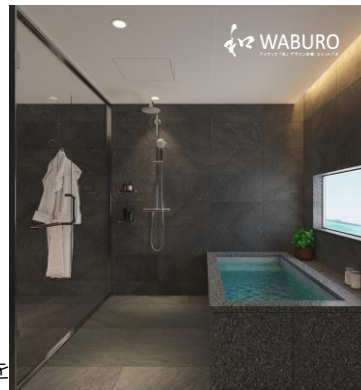
Premier RESORT プレミアリゾート

ユニットバスルーム全体構成にはシンプルトーンで飽きのこない質感豊かな天然石の色調・上質な風合いでご家族どなたにでも見合う「Hi-Ceramics」 Quartz (クォーツ) ベージュを採用しました。「肌ざわり」と「スムーズな吐水」にこだわった優美繊細な水流をつくる高級サーモシャワー混合栓、そして、お好みの調光でやすらぎの時間をやさしく照らす間接照明と相まって、お好みの「癒しと寛ぎ」の趣空間を醸し出します。心も身体もリラクゼーションの彼方へと誘います。