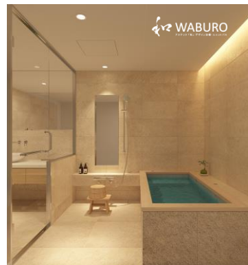
Premier MAISON プレミアメゾン

浴槽の顔となる框(かまち)には心地よい芳香とフィトンチッドを放つ自然素材「ヒノキ」、そして浴槽内装には、希少天然石で遠赤外線・マイナスイオンを発生する「十和田石」を標準採用したまさに「ナチュラルウェルネス」健康志向の自然素材浴槽のラグジュアリーユニットバスとなります。ウェルネス(Wellness)とは、これは健康の為の手段・プロセスというニュアンスをもち、病気の治療・予防という範疇を超えて、生き生きとした生活を送る為の行動に重点を置いた考え方で健康になる為の心身活動を提案するものです。自然素材を大切に「和 WABURO」は「ナチュラルウェルネス」コンセプトを加え、この「WABURO Premier MAISON」でご提供します。